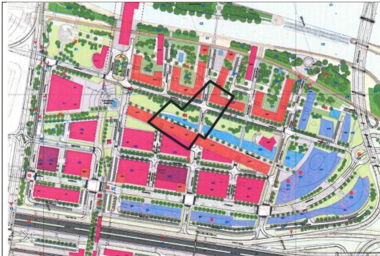
Grafická príloha č. 2 - účastník Vodotika

Posúdenie žiadostí a podnetov evidovaných v rámci preskúmania Územného plánu zóny celomestské centrum – časť Petržalka, územie medzi Starým mostom a Prístavným mostom, v znení zmien a doplnkov, textová časť, 09/2025.